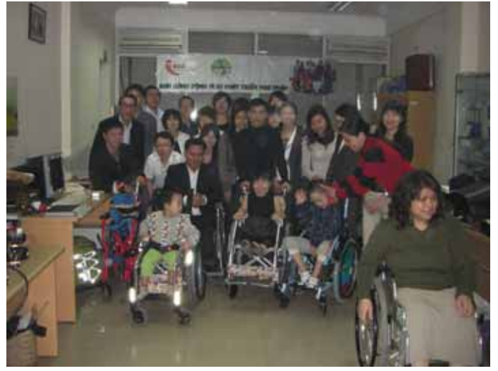
日本から運んでいった車イスの贈呈(ハノイ)