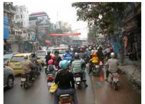
おびただしいバイクの数(ハノイ)