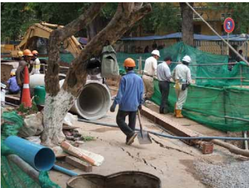
日本の援助によって進められている市内の下水道工事(プノンペン)