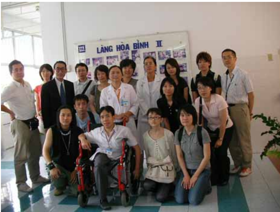
ツーツー病院のスタッフと(ホーチミン) (前列車いすは日本で分離手術を受けたドクさん)