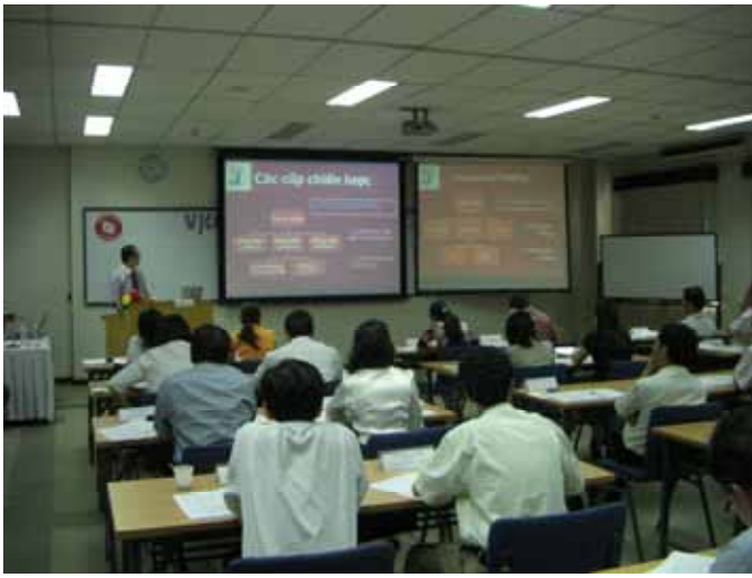
ベトナム・日本人材協力センター(VJCC)で熱心に講義を聞く受講者(ホーチミン)