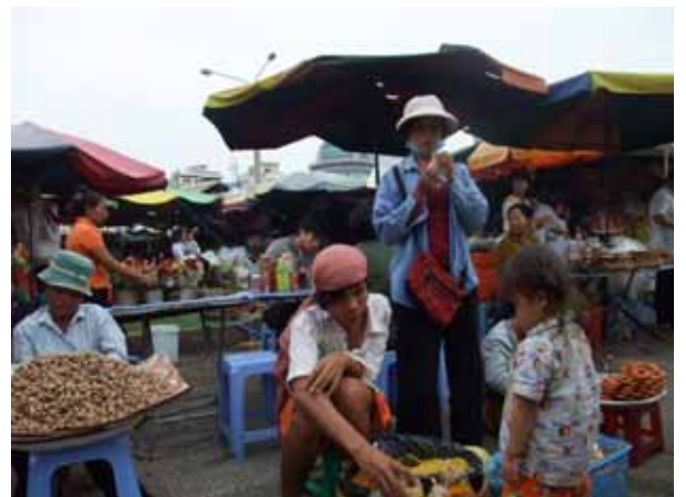
市民の台所として親しまれている市場周辺(プノンペン)