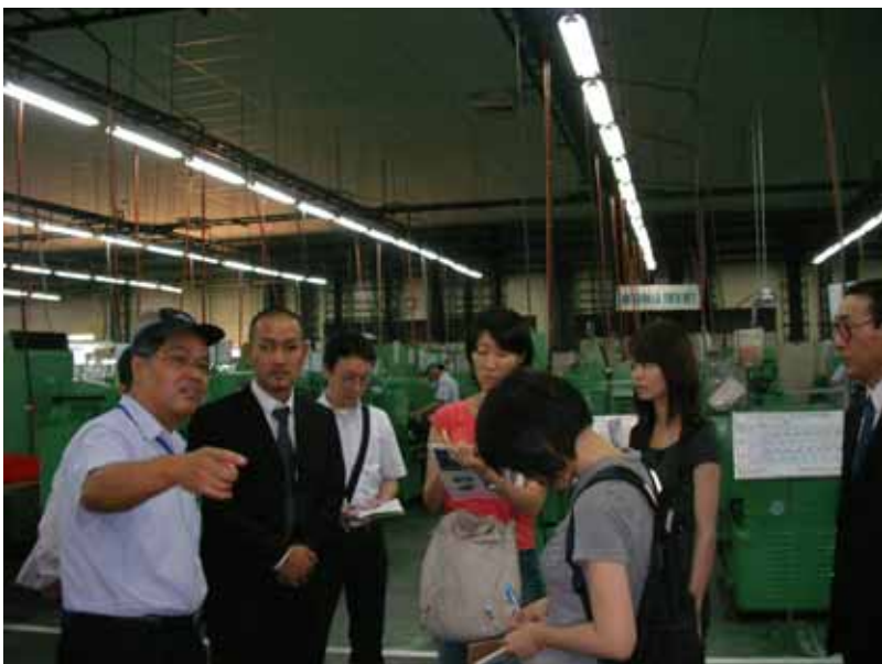
日本企業工業用ミシンの最大手「JUKIベトナム工場」を訪れ、製造工程の説明を聞く(ホーチミン)