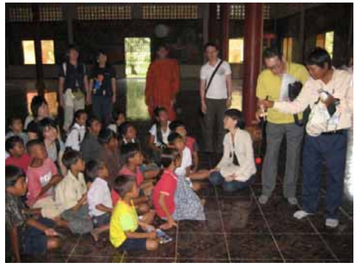
SCCから支援を受けている子ども達とけん玉を使い交流(シェムリアップ)