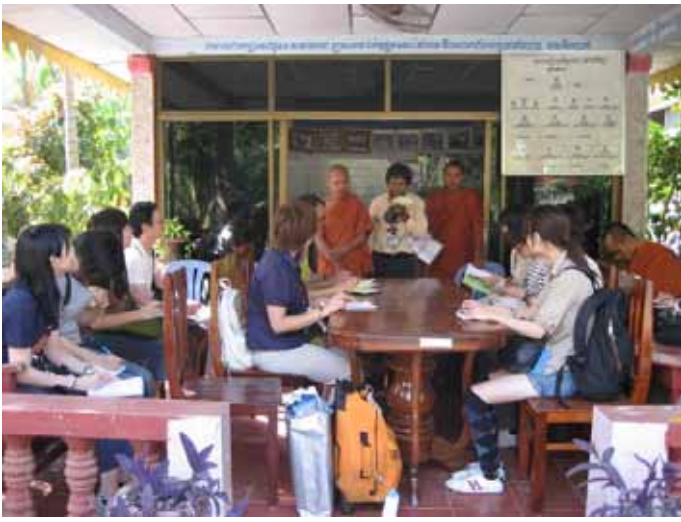
HIVに関する教育・サポートを目的に設立されたNGO (SCC)代表のお坊さんから話を聞く(シェムリアップ)