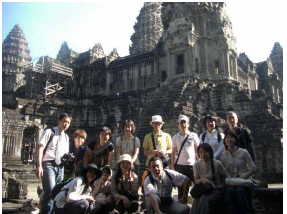
アンコールワット遺跡を背に(シェムリアップ)