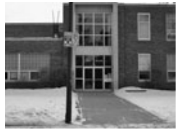
閉鎖回避のため教室利用を勧誘されている学校

北方圏センターが今年創立30周年を迎えると聞きました。思えば、私が「北方圏」(旧誌名)に寄稿し始めたのも1978年ですので、これまた30年の月日が流れました。1976年にカナダに移住、我が家の居間で寺子屋式に始まったサスカトゥーン日本語補習校も正式に登録されて今年で30周年です。