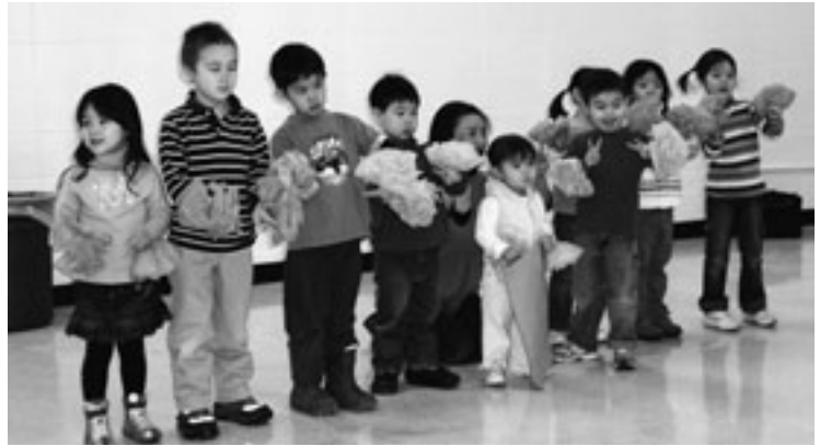
学芸会での幼児部のこどもたち

当時は帰国子女教育援助が目的でした。日本からの資金援助の占める割合も大きいので永住者が増えて帰国子女が減少している近年は運営も憂慮されていましたが、日本国籍をもつ永住者子女も資金援助の対象になってホッとします。国際結婚組の子女たちは殆ど日本国籍も獲得しており、また学齢期前の子どもが多数いるため、開校以来初めて幼児部を創設しました。