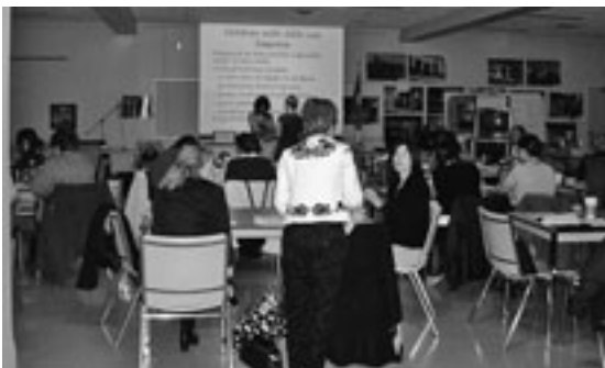
自閉症再研究の研修会の様子

「急ぐ用事は忙しい人に頼め」といわれますが、ここでも同じで、皆忙しく過ごしながらも子供達の為の時間も惜しまず、限られた日常を有効に使いこなしています。