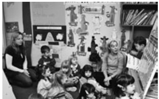
孫の通うプリスクールのある日の様子