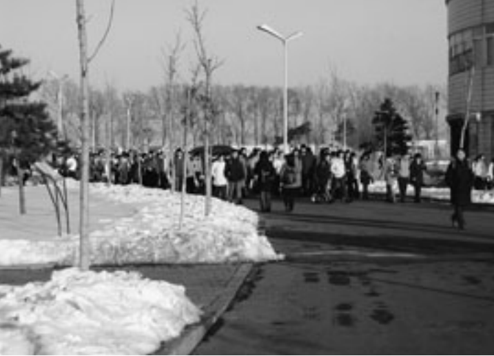
大学構内を歩く中国人学生

私は2006年2月から2007年1月までを中国遼寧省瀋陽市にある瀋陽師範大学で過ごした。8年前、中学生だった私が初めて踏んだ外国の地、それが中国だった。それをきっかけに世界の中でもアジアに興味を持ち、大学生となった私は教育大学の交換留学制度を利用して中国への留学を決意したのである。同じアジア人、容姿はもちろんのこと、生活文化や精神文化も似ているのだろうと思っていた。そして「中国」に対して漠然としたイメージをもって乗り込んだ。そこでの様々な人との出会いは、私を異文化理解に近づけてくれた。