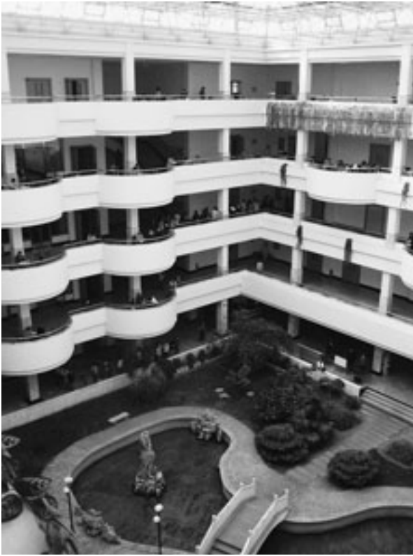
大学内の図書館、自習する学生で混雑する

の私は終始外を見る。当たり前だが漢字のみの看板、日本のような一軒家は少なく、大きなアパート群がこれでもかというくらい整然と並んでいて、街に入ると2月のまだ寒い中、露店を並べる人たちが賑わう。中国へ来たのだと実感していた。