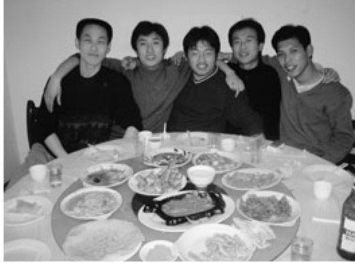
食事を楽しむ中国人学生たち

合うためには仕方ないのだ。前の晩に銭湯から汲み置きしていたお湯で顔を洗ったら朝ごはんを食べに行く。周知のとおり中国の朝ごはんはお粥だ。たいていの食堂にはふつうの白いお粥と八宝粥という八種の豆を使ったお粥が用意されている。どちらも一杯5角（8円くらい）と格安。特徴は日本のお粥より水分が多いこと。お腹はいっぱいになるがすぐに空くのも事実。お粥と一緒に食べるのは「包子」という小さな肉まん、10個ほど入っている。