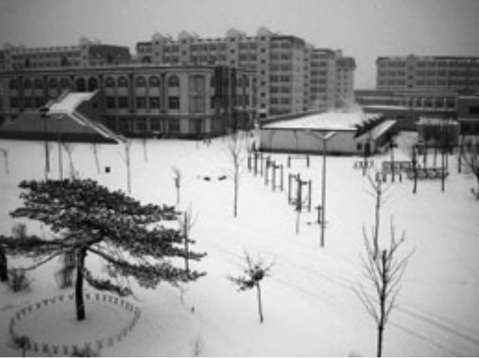
大学構内。奥に見えるのは学生寮