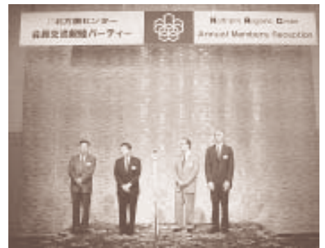
親睦パーティーで紹介される札幌駐在外国公館の代表のみなさん

5月22日（火）午後4時から、今年度の「通常総会」を札幌プリンスホテルで開催した。平成12年度の事業実績、収支予算を報告、平成13年度の事業計画案、収支予算案を提案し、それぞれ承認された。